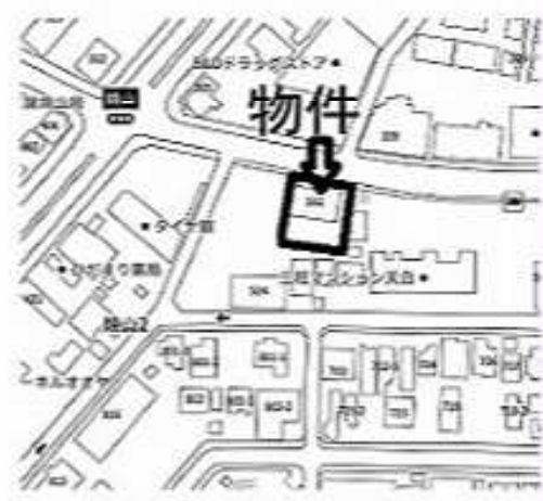
名古屋市天白区焼山二丁目502番